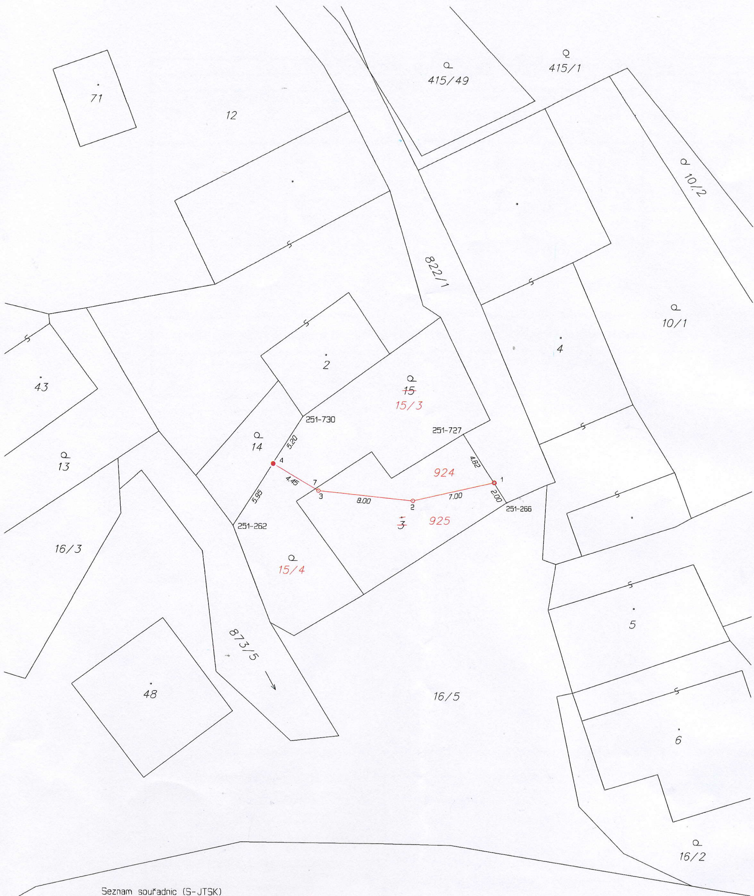
Seznam souřadnic (S-JTSK) Číslo bodu Souřadnice pro zápis do KN Y X Kód kv. Poznámka