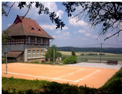
Společenské organizace v obci